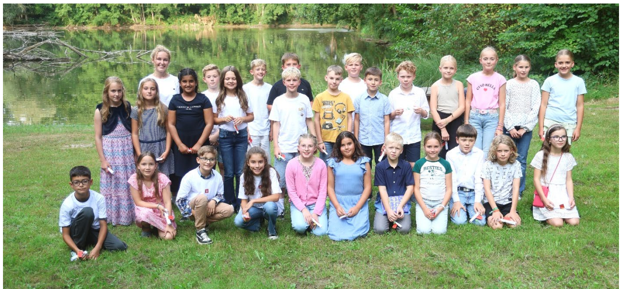
Unsere Sexta 2025/2026