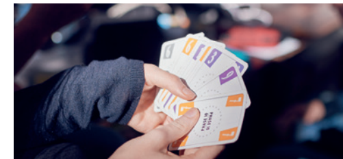
Spiel & Spaß

Um die letzte Müdigkeit der Nacht zu vertreiben, findet morgens vor der Kursarbeit ein Sportprogramm statt. In der Mitte der Woche steht eine Exkursion (z.B. in den nahe gelegenen Burgers' Zoo Arnheim) auf dem Programm.